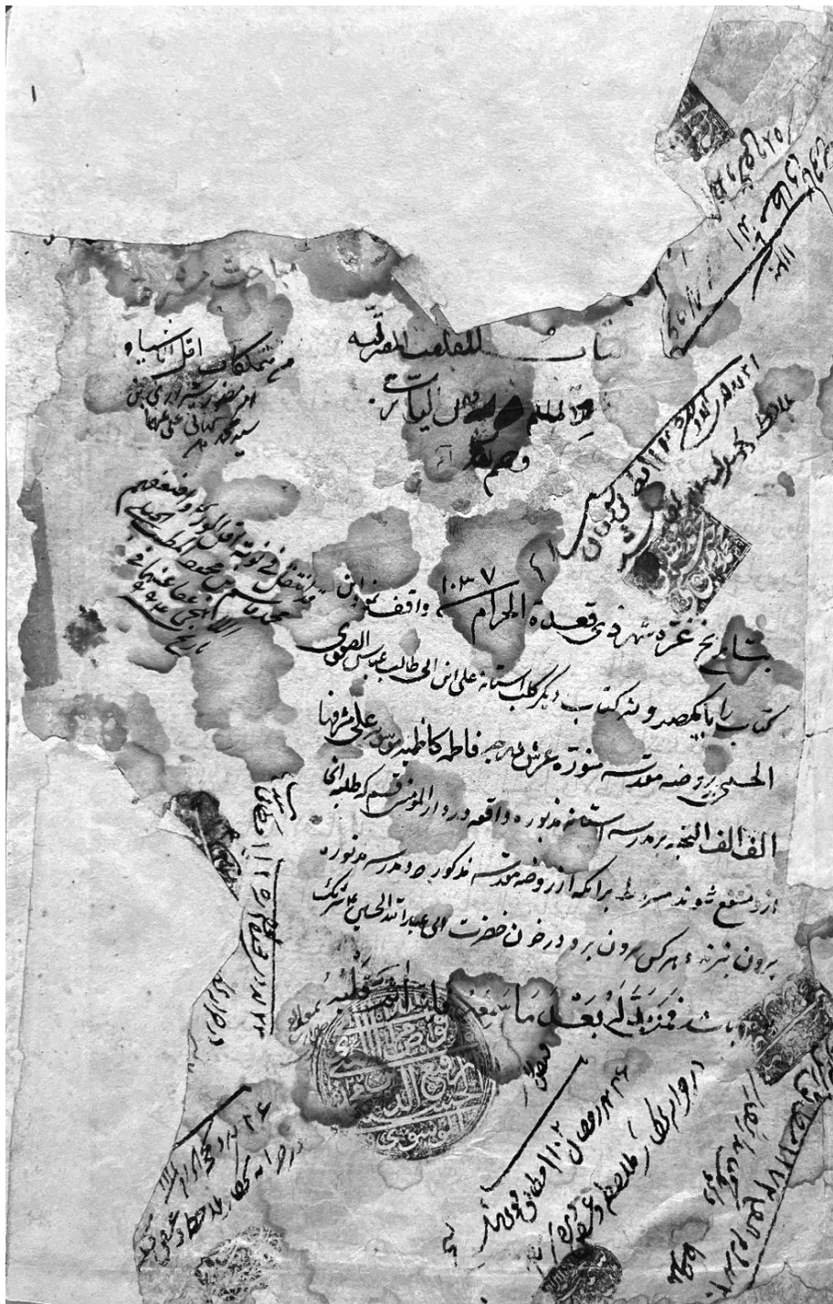
- سال ۱۴۰۳. وقف نامه المباحث المشرقیه که نشان از آسیب